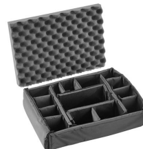
iM2300-DIV Divisores acolchados