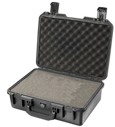
iM2300-X0001 With Foam