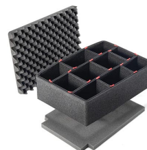
iM2300TPKIT TrekPak Case Divider Kit