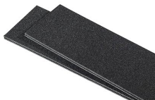
1525TPDIV Extra TrekPak Dividers