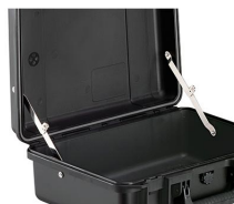
iM-LIDSTAY Soporte de tapa