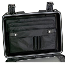
iM2300-LIDORG Organizador de tapa