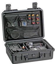
iM2300-PHOTOPALLET Pálet para fotografía