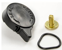
iM-VALVE-M-B Válvula de purga manual