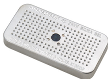
1500D El gel de sílice desecante Peli