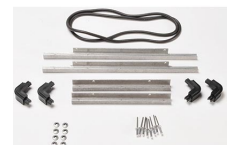
iM2300-BEZEL-LID Marco para instalaciones electrónicas con tapa